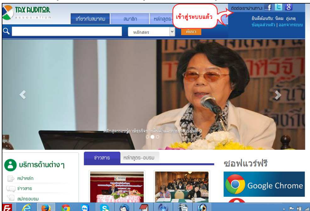
รูปที่ 16: แสดงลิงค์ ข้อมูลส่วนตัวและ ออกจากระบบ

3.2 เมื่อเข้าสู่ระบบแล้วกล่องนั้นจะชื่อผู้ใช้งานและลิงค์ “ข้อมูลส่วนตัว” และ “ออกจากระบบ” (รูปที่ 16)